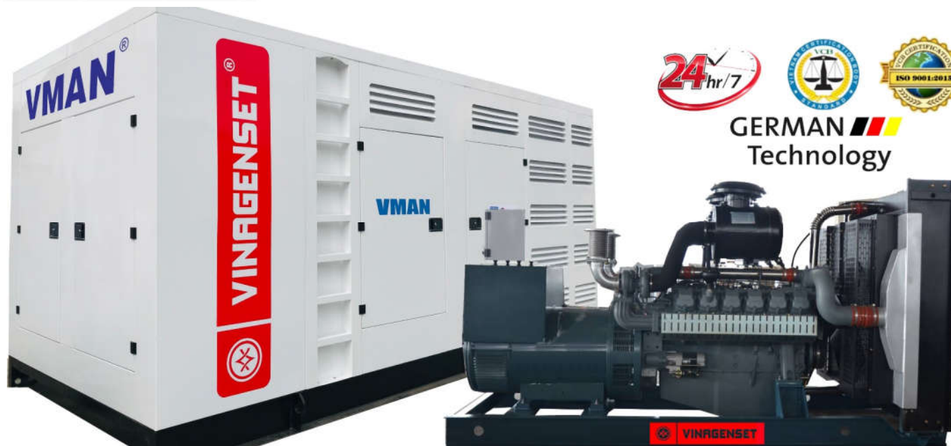
(Hình ảnh tham khảo)