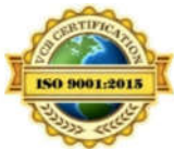
(Hình ảnh tham khảo)