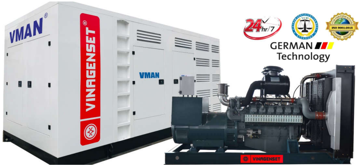
(Hình ảnh tham khảo)