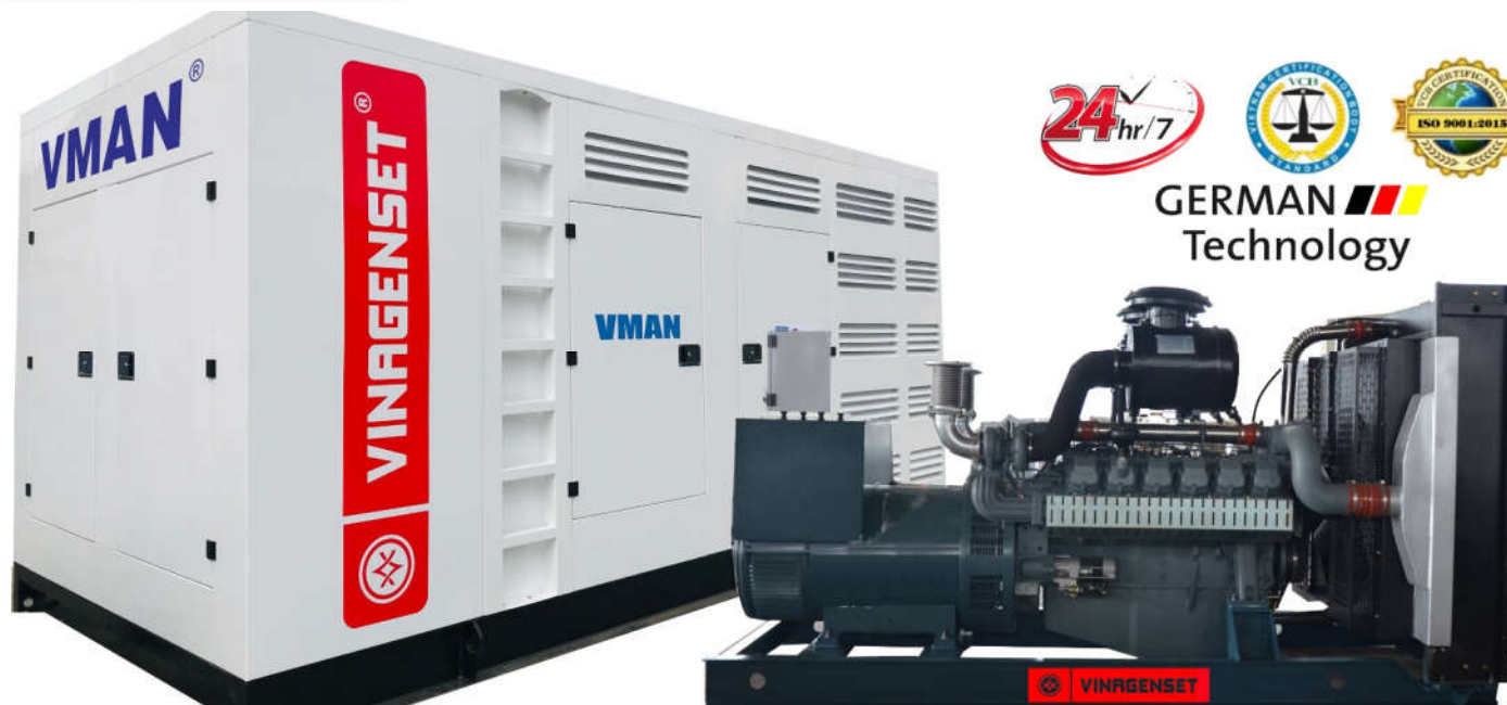
(Hình ảnh tham khảo)