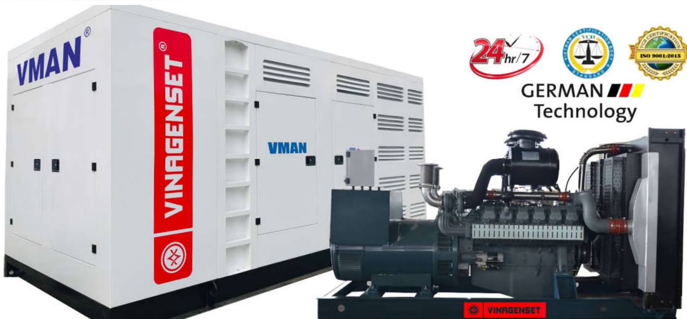
(Hình ảnh tham khảo)