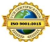
(Hình ảnh tham khảo)